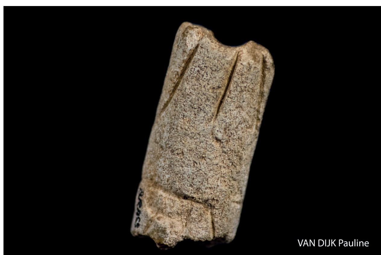
VAN DIJK Pauline

Fragment de bois de cervidé perforé et orné de motifs géométriques.